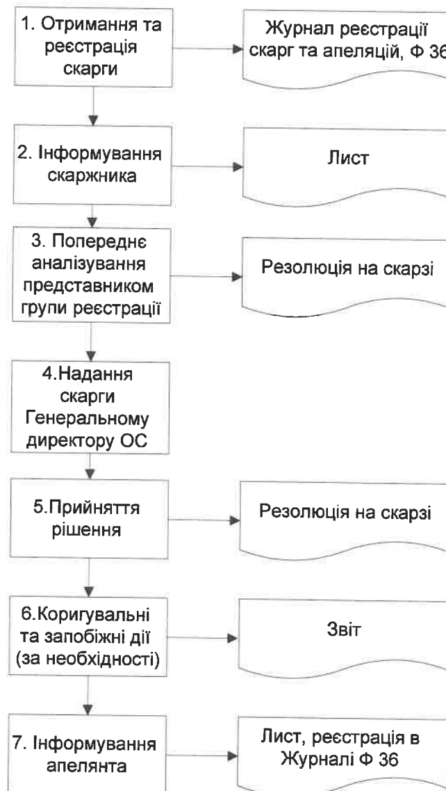
Схема процесу отримання, підтвердження та розглядання скарг